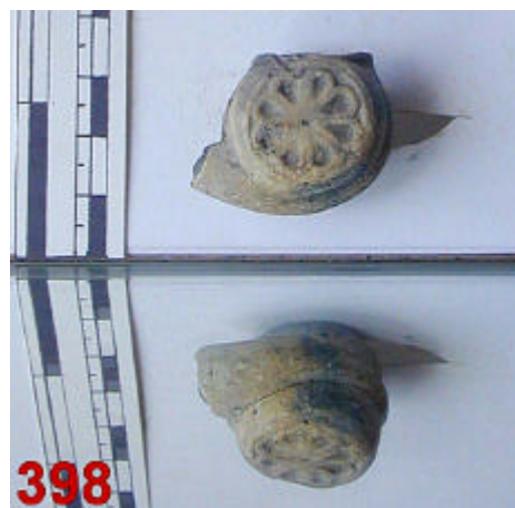
Terre noire avec couverture chamois di = 15, Hf = nc, dt = nc, Cf = nc

Ci-contre la moitié du fourneau qui a permis, en combinaison avec l'exemplaire n°048, la photo montage située en tête de chapitre. On notera que le motif décoratif est différent de celui des deux pipes précédentes.