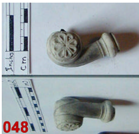
Terre blanche di = 13, Hf = nc, dt = 7.5, Cf = nc